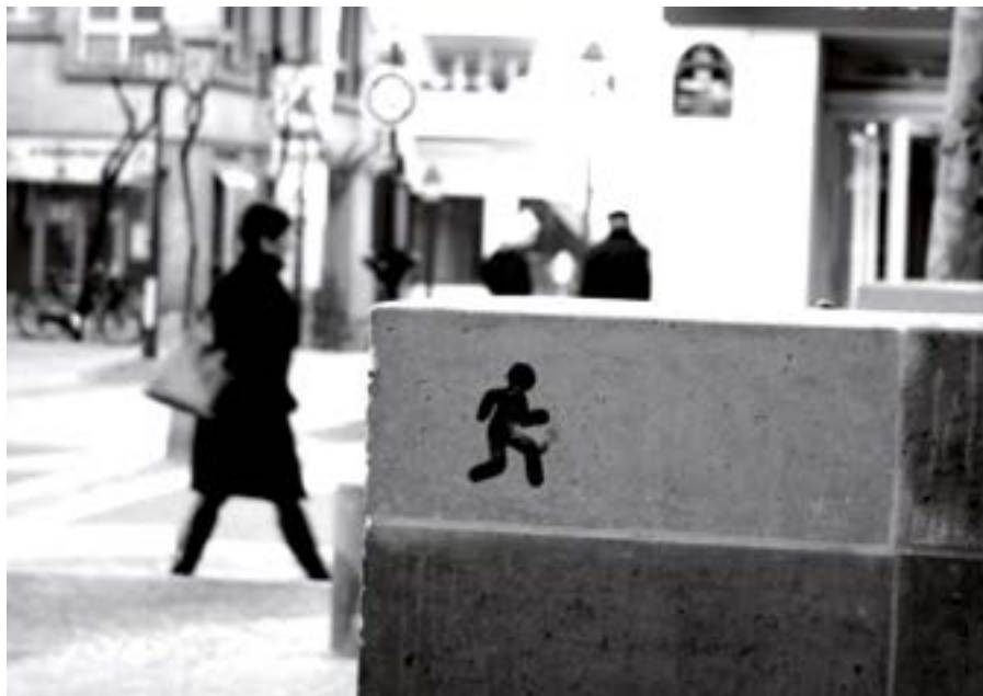
BONHOMME DE CHEMIN, Parvis du centre Beaubourg