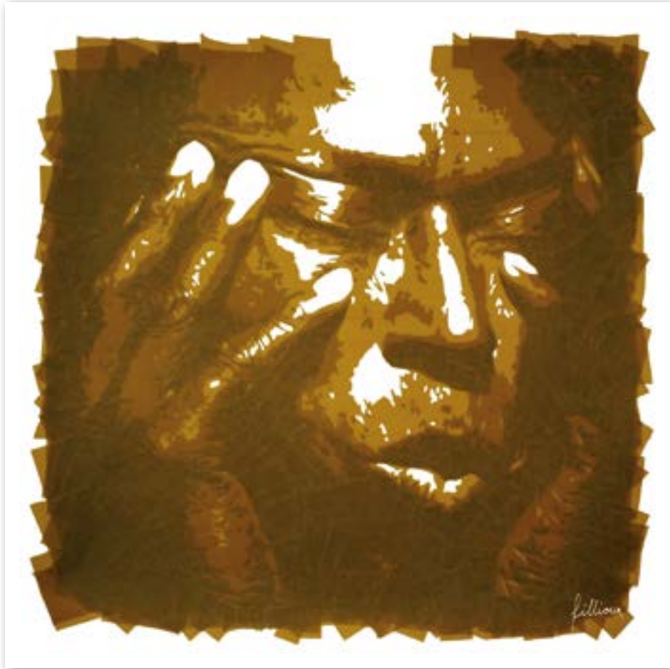
MILES AHEAD, scotch Havane sur papier Artiste : © Pauline Fillioux

« Lancé officiellement en 2013 avec des premiers appels à proposition dès début 2014, Europe créative est le nouveau programme-cadre de l'Union dédié aux secteurs culturels et créatifs pour la période 2014-2020.