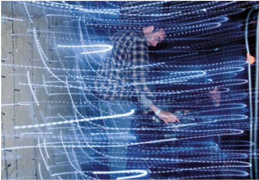
Concert du groupe CONTAINER – Garage MU