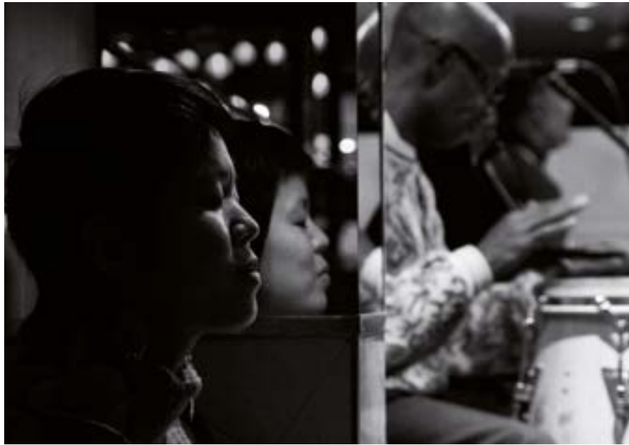
SOUND EXPERIENCE

Quelles que soient leurs échelles, les projets ne peuvent dépasser une durée de 48 mois.