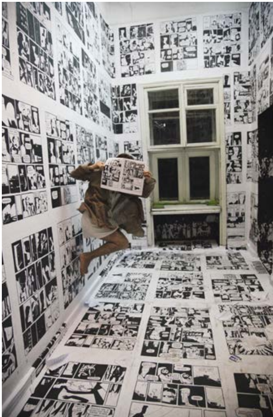
TANDEM - CRÉATION DE NOUVEAUX LIENS CULTURELS TRANSNATIONAUX ENTRE L'UKRAINE ET LA MOLDAVIE