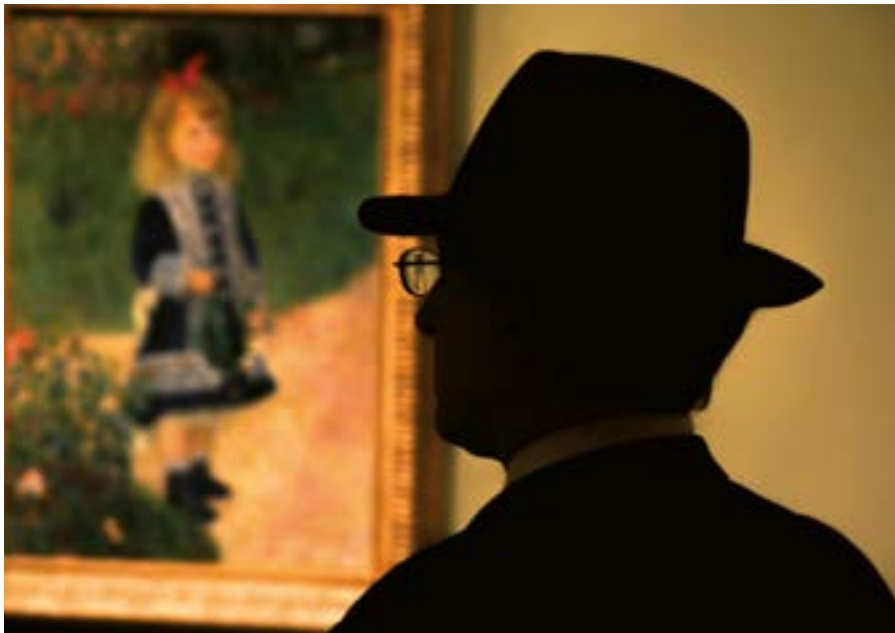
Sans titre