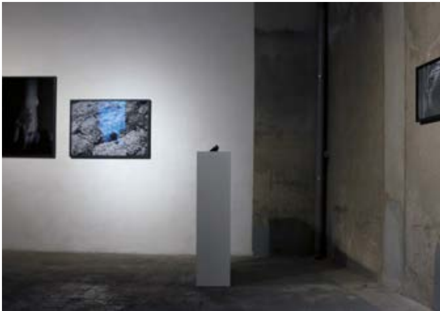
SOMETHING IN THE WAY de Vincent Voillat