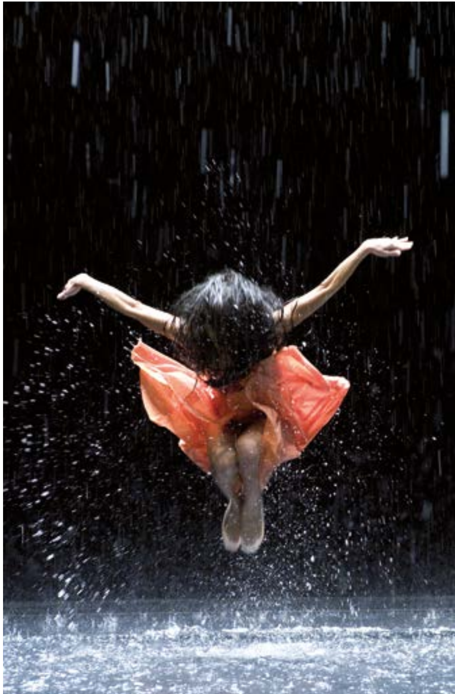
PINA de Wim Wenders

Le titre de Capitale européenne de la culture a été initié par le Conseil des ministres de l'Union européenne en 1985, sur l'initiative de l'ancienne Ministre de la culture grecque Melina Mercouri, et de son homologue français Jack Lang.