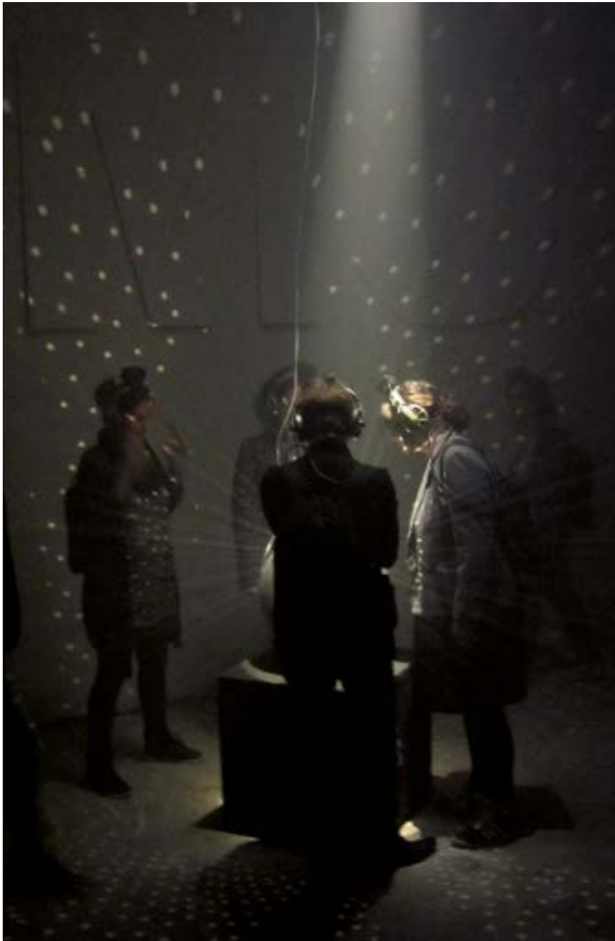
EQUINOXE CARDAMINE, collectif

des professionnels et des artistes, etc.